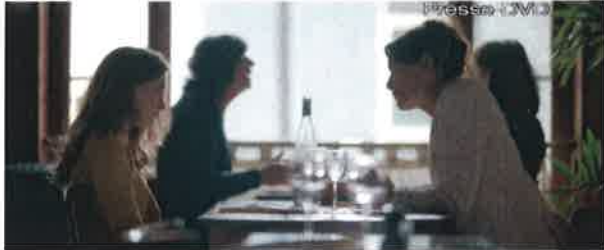
1 Dorothy und ihre Mutter

Durch die Anordnung der Figuren im Bild erzählt der Film auch darüber, wie diese zueinander stehen. Beschreiben Sie anhand der folgenden Standfotos die Beziehungen zwischen Dorothy und ihrer Mutter beziehungsweise ihrem Vater (Bild 1 und 2), zwischen Christine und Paul (Bild 3) sowie zwischen Dorothy und Paul (Bild 4). Achten Sie beispielsweise auf die Abstände zwischen den Figuren und wodurch diese getrennt werden, auf die Lichtwirkung (warme oder kalte Farben) oder die Körperhaltung der Figuren.