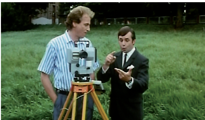
Situation 2: Gespräch mit dem Landvermesser (00:02:37–00:04:15)