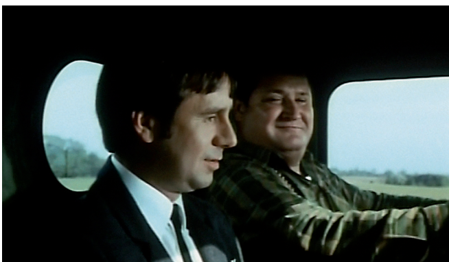
Situation 3: Treffen mit Most (00:04:20–00:06:00)