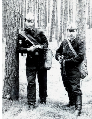
Soldaten der Sowjetarmee in Deutschland

Nach dem Fall der Mauer gelingt es der deutschen Regierung, die ehemaligen Besatzungsmächte USA, UdSSR, Frankreich und Großbritannien davon zu überzeugen, dass die beiden deutschen Staaten wiedervereinigt werden sollen. Die Sowjetunion stimmt einem Rückzug ihrer Truppen aus der DDR zu. Es ist eine der größten Truppenbewegungen zu Friedenszeiten überhaupt: Die Sowjetarmee verfügte zeitweise über 280 Standorte und 50 Flugplätze; bis zu 500.000 Soldaten und 7.500 Panzer waren in Ostdeutschland stationiert.