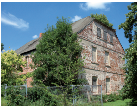
Verfallenes Herrenhaus in Brandenburg

Nach dem Krieg wurden viele Eigentümer/innen von der russischen Besatzungsmacht von ihren Besitztümern vertrieben. Nach 1989 fordern viele eine Rückgabe, auch wenn inzwischen längst andere Menschen die Gebäude nutzen. Viele historische Bauten sind während der DDR-Zeit verfallen. Spekulanten/innen wollen billig Immobilien kaufen, um sie nach der Renovierung teuer weiterzuverkaufen oder zu vermieten. Das klappt aber oft nicht – große und kleine Anleger/innen erleiden mit Immobiliengeschäften in den 1990er Jahren Milliardenverluste.