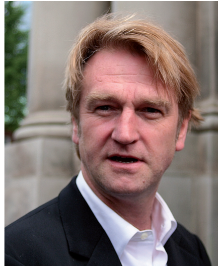
Detlev Buck, Regisseur und Drehbuchautor

Dies ist auch deswegen sinnvoll, weil etliche Nebenfiguren nur kurz auftauchen und einige Situationen eher en passant gelöst werden. Zu sprechen wäre über die unsichere gesellschaftlich-soziale Lage in einem Land des Umbruchs, über enttäuschte Hoffnungen auf die versprochenen „blühenden Landschaften“ (Helmut Kohl 1990), über Spekulanten/innen und arglistige Geschäftsleute, über das als Bevormundung empfundene Auftreten westdeutscher Politiker/innen, Manager/innen und Alteigentümer/innen. Schließlich ist ein Hinweis auf den Abzug der Sowjet-Armee unerlässlich, um zu verstehen, dass eine Figur wie der Deserteur Viktor genau in diese ostdeutsche Umbruchlandschaft passt.