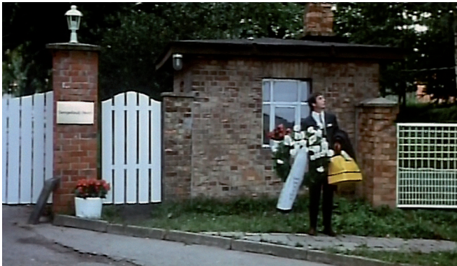
Situation 1: Warten vor dem Tor (00:01:22–00:02:52)