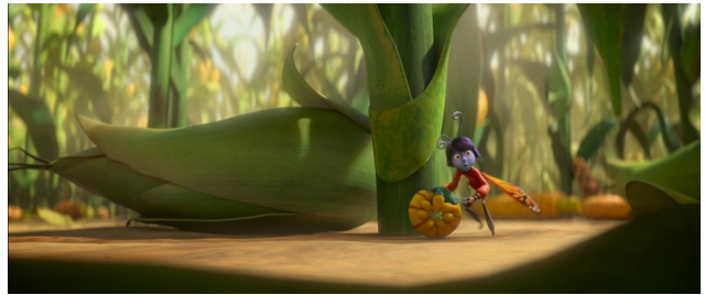
2 Verhalten bei Gefahr