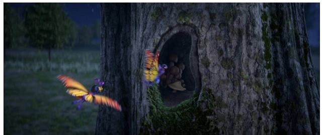
4 Verhalten bei Nacht