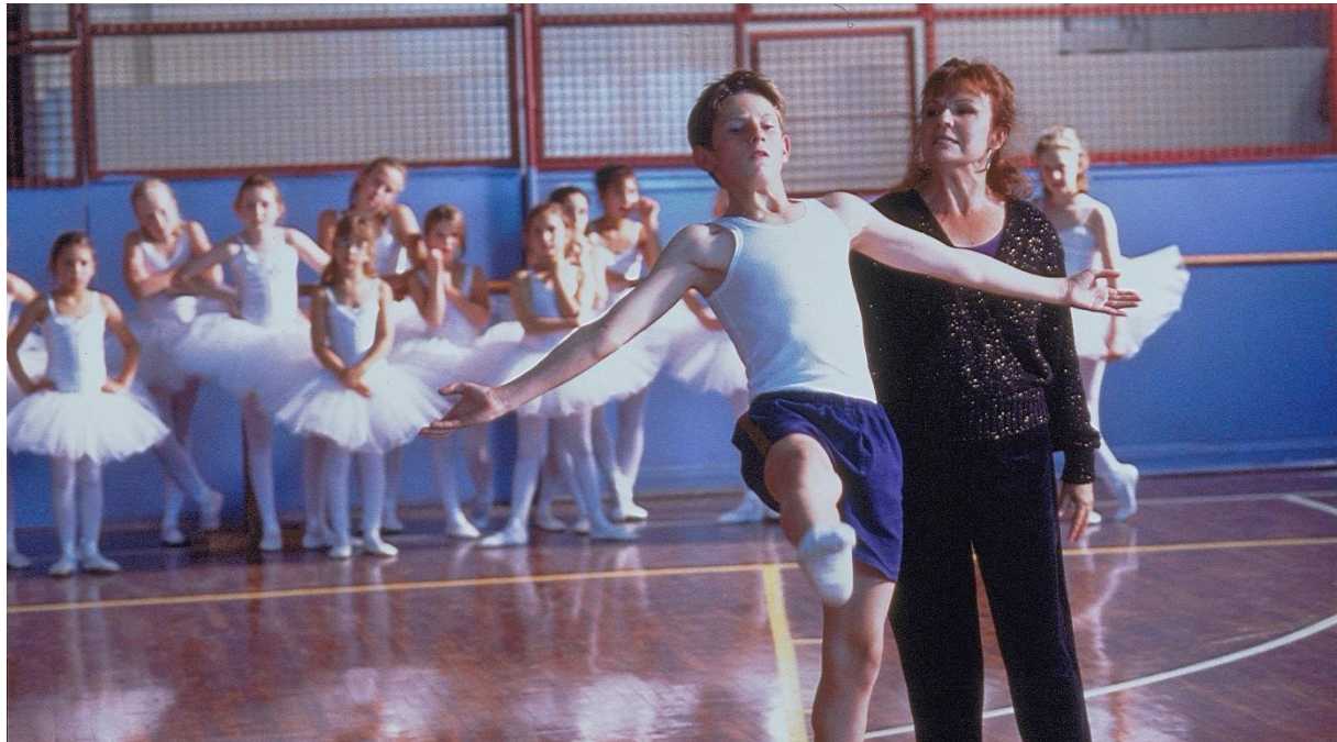
"Billy Elliot - I Will Dance" auf Blu-ray & DVD erhältlich