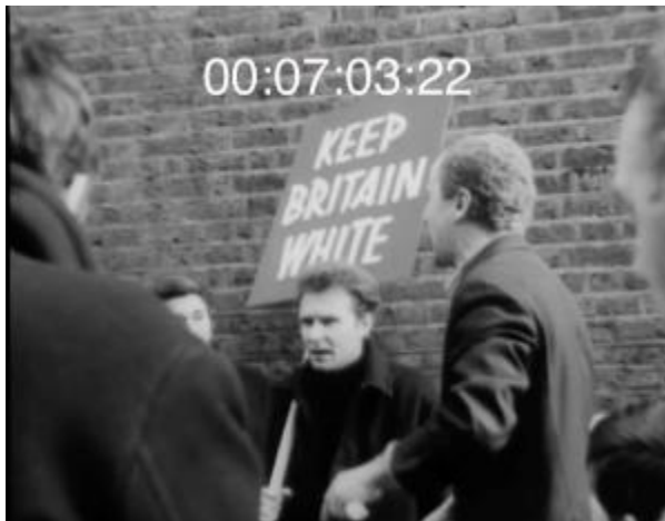
„Haltet Großbritannien weiß“