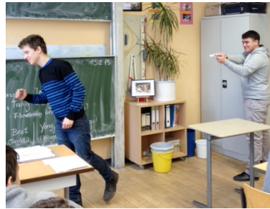
(BEST gerät in einen Schusswechsel)