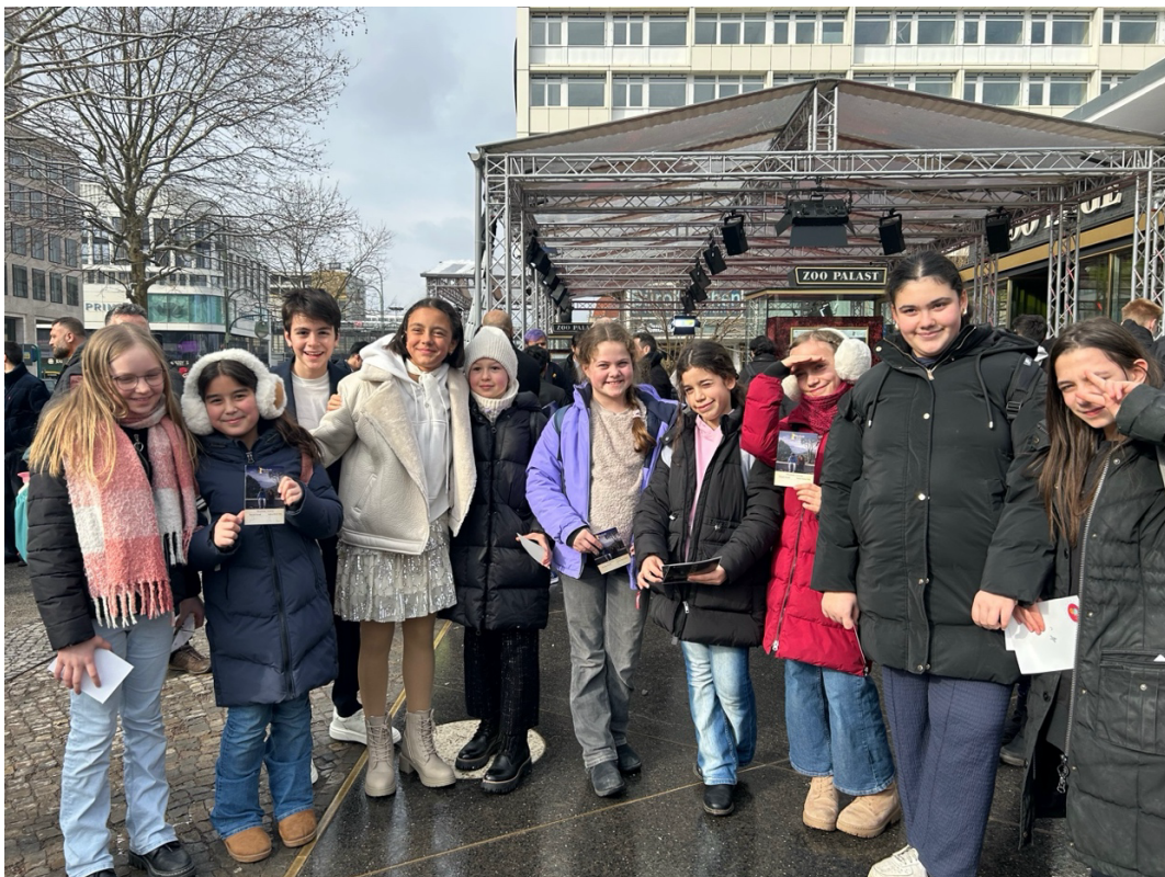
Schülerinnen der 5d mit den beiden HauptdarstellerInnen aus dem Kurzfilm Yerçekimi vor dem Zoo-Palast