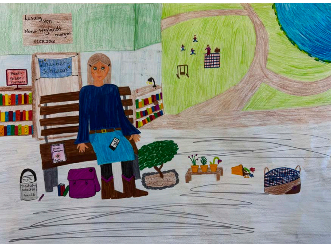
Ich in 20 Jahren