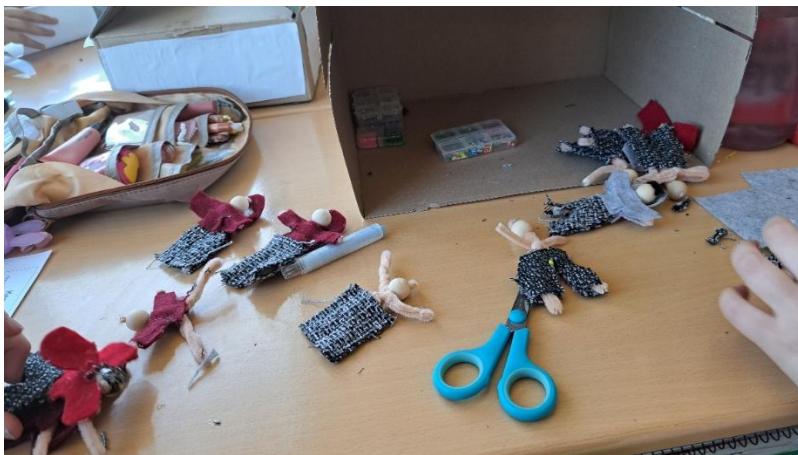
Entstehung von „Deniz-Puppen“